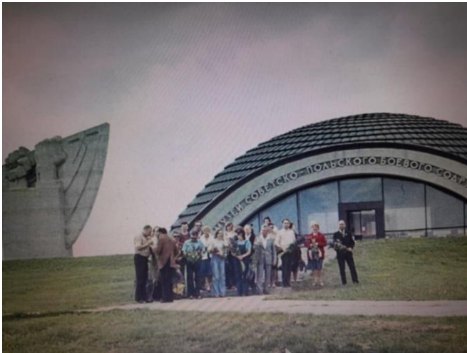
Lenino – mauzoleum.