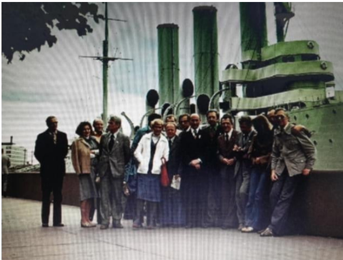
Leningrad – krążownik Aurora.