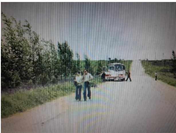
Na drodze do Lenino.