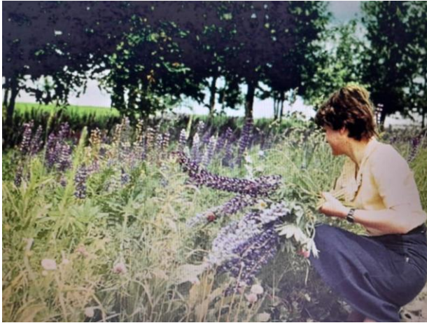
Droga do Lenino – łubiny.